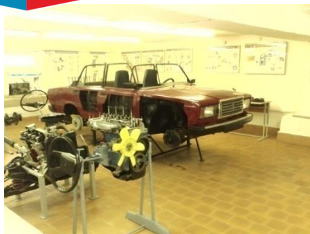
Кабинет 4 корпус «В» Кабинет по устройству легковых и грузовых автомобилей

В кабинетах кафедры проводятся лабораторные работы по следующим дисциплинам: