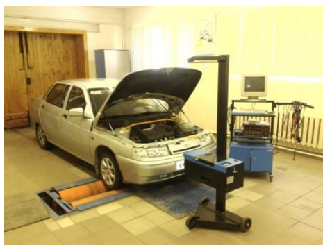
Кабинет 113 корпус «В» Кабинет по техническому обслуживанию и ремонту автомобилей

Основные социальные партнеры кафедры по реализации содержания ООП, на которых студенты проходят производственное обучение: