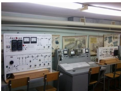
Кабинет 1 корпус «В». Лаборатория силового электрооборудования, кабинет электроснабжения