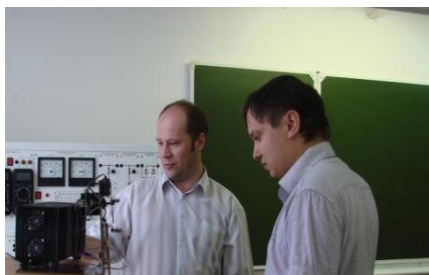
Кабинет 203 корпус «В». Лаборатория силового электрооборудования