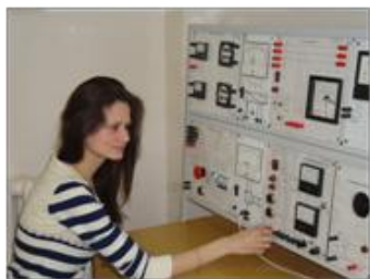
Кабинет 201 корпус «В». Лаборатория электротехнических дисциплин