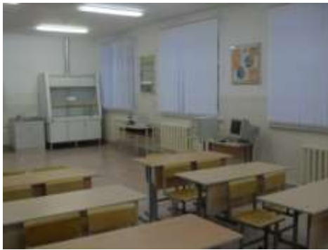
Лаборатория химии, каб. 309