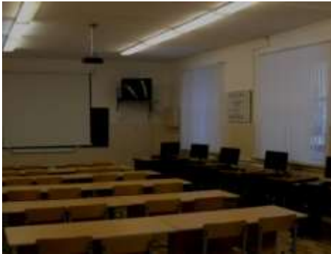
Компьютерный класс, каб. 301