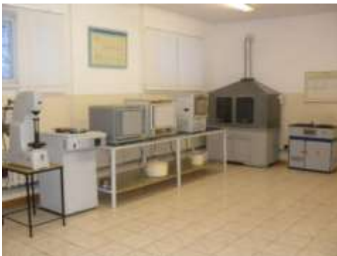
Лаборатория металлургии, каб. 103

В компьютерных классах кафедры установлено программное обеспечение: Kompas 3D, AutoCad, Microsoft Office, MathCad и др., которое используется в учебном процессе при проведении практических занятий по дисциплинам: